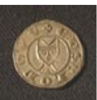
Denier d'argent frappé à l'effigie de Saint-Fulcran, Musée Languedocien, Montpellier.

Après quatre siècles successivement marqués par l'administration des Wisigoths, la domination des Francs, le passage des musulmans, une nouvelle période s'ouvrit au IX e siècle avec des donations faites à Lodève par les successeurs de Charlemagne. Au X e siècle, un évêque augmenta