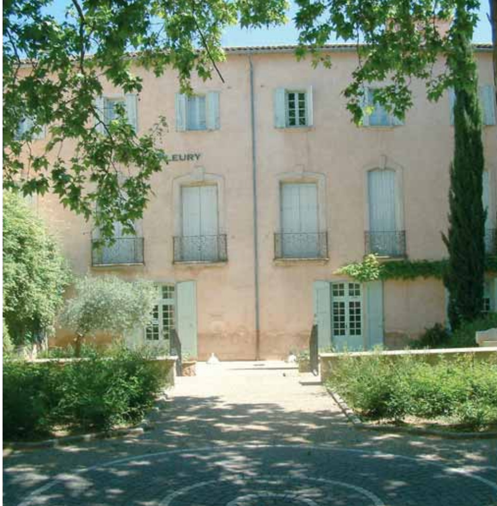
Square Georges Auric