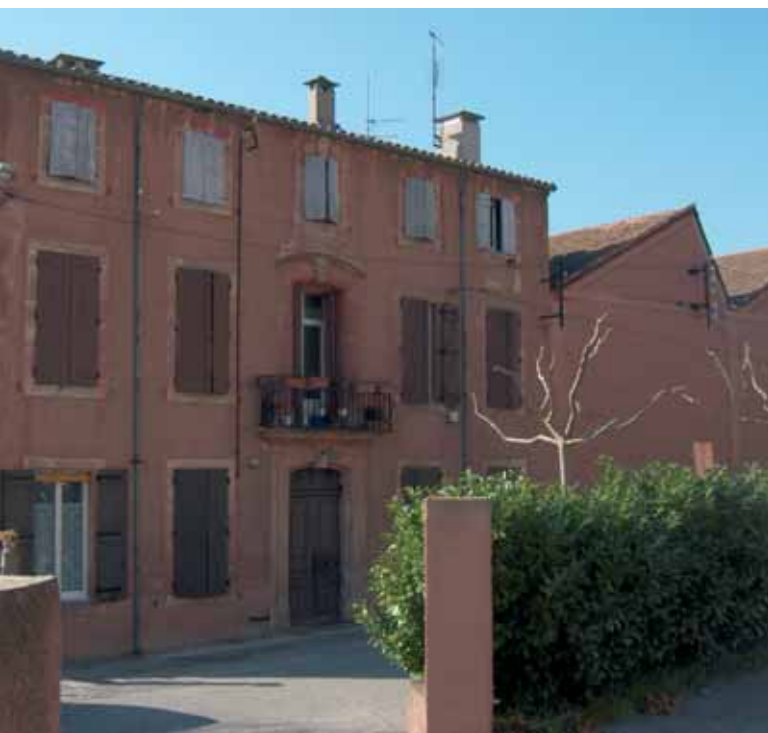
Ancienne usine textile de Bellerive, rive gauche de la Lergue