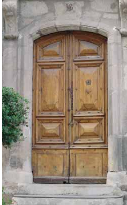
Porte XVII e s.