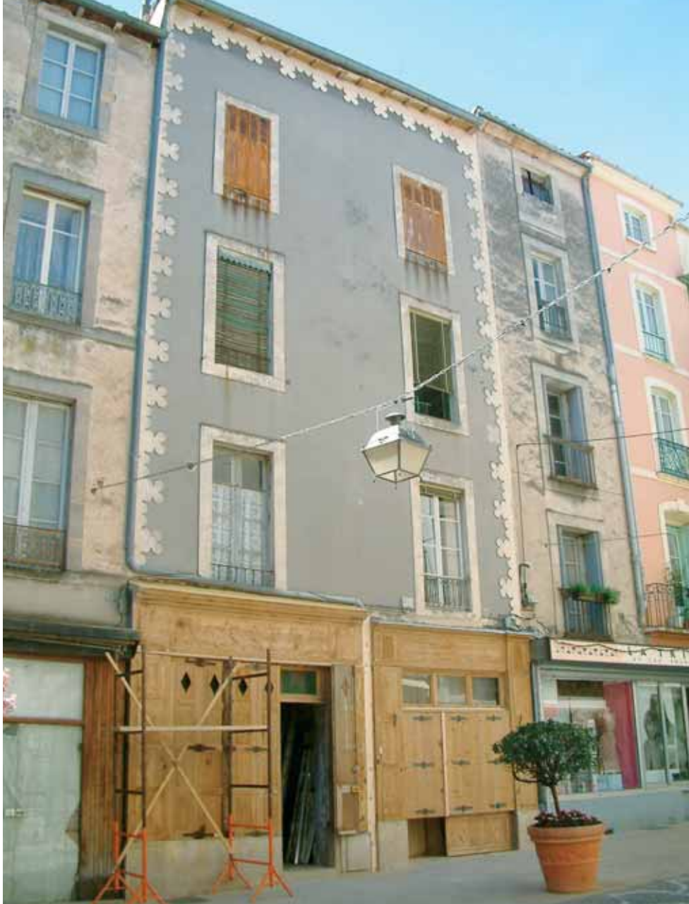
Restauration de la devanture d'une ancienne boutique, 2006

tenu de respecter l'esprit de la Z.P.P.A.U.P., ses objectifs patrimoniaux, ses prescriptions et ses recommandations. En cela, la Z.P.P.A.U.P. a l'avantage de proposer un outil qui, par sa caractéristique de référence commune et par la consensualité de son principe, permet de préserver un patrimoine pour lequel on demande à la population de s'engager elle aussi.