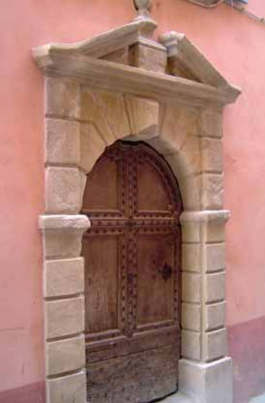
Porte XVI e s.