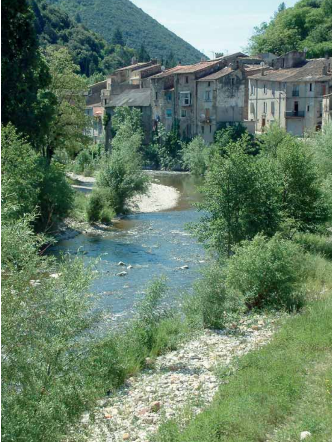
Au confluent des rivières de Lodève