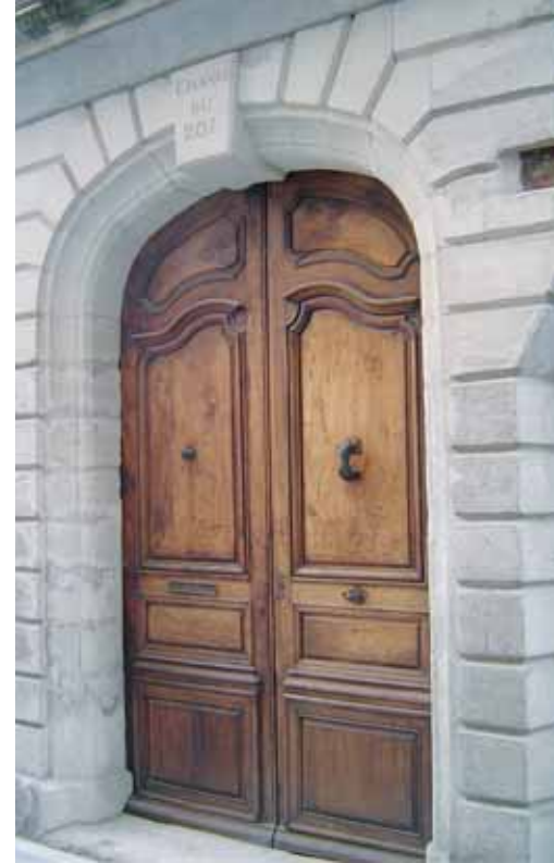
Porte XVIII e s.