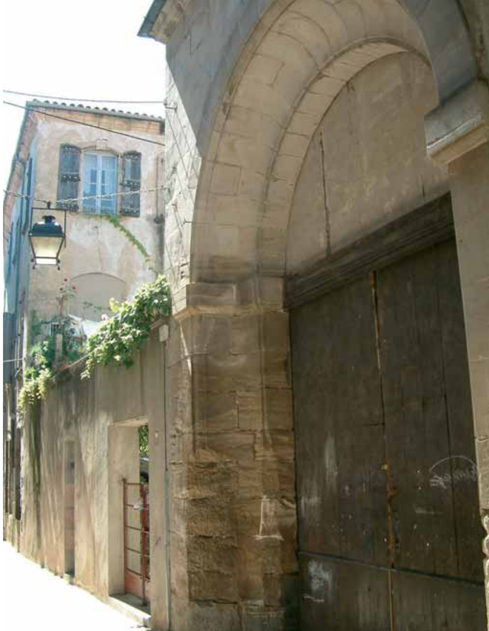
La porte charretière de l'Hôtel de Fozzières, rue du Cardinal de Fleury