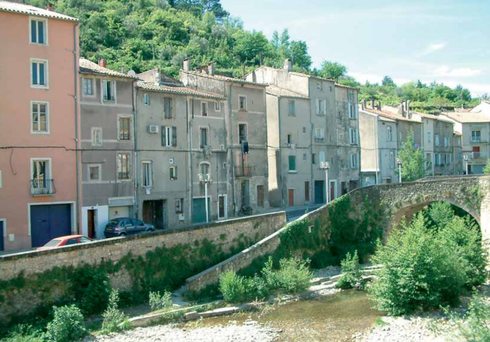
Le Faubourg Montbrun s'étire le long de la Lergue