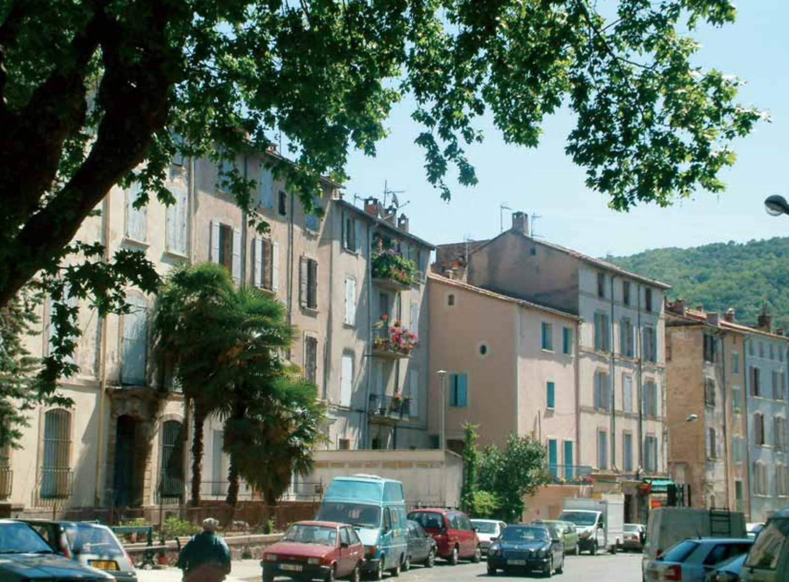
Le boulevard Pasteur

Parfaitement consciente du fait que la Z.P.P.A.U.P. n'aide pourtant en aucun cas à la restauration à proprement parler du patrimoine bâti, la Municipalité souhaite en particulier utiliser la Z.P.P.A.U.P. comme un cadre au sein duquel il serait possible de mettre en place des outils opérationnels et par voie de conséquence un plan efficace de restauration et de réhabilitation, en partenariat avec l'Etat, le Service de l'Architecture et du Patrimoine et les collectivités territoriales.