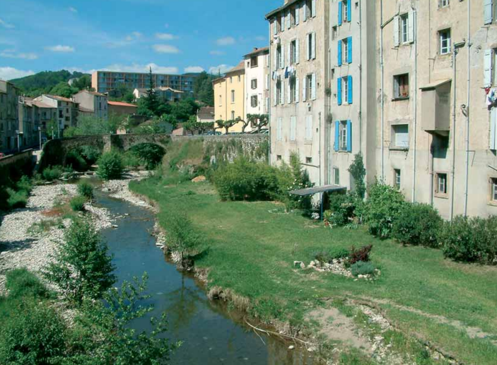
Les berges de la Lergue et le pont de Montbrun