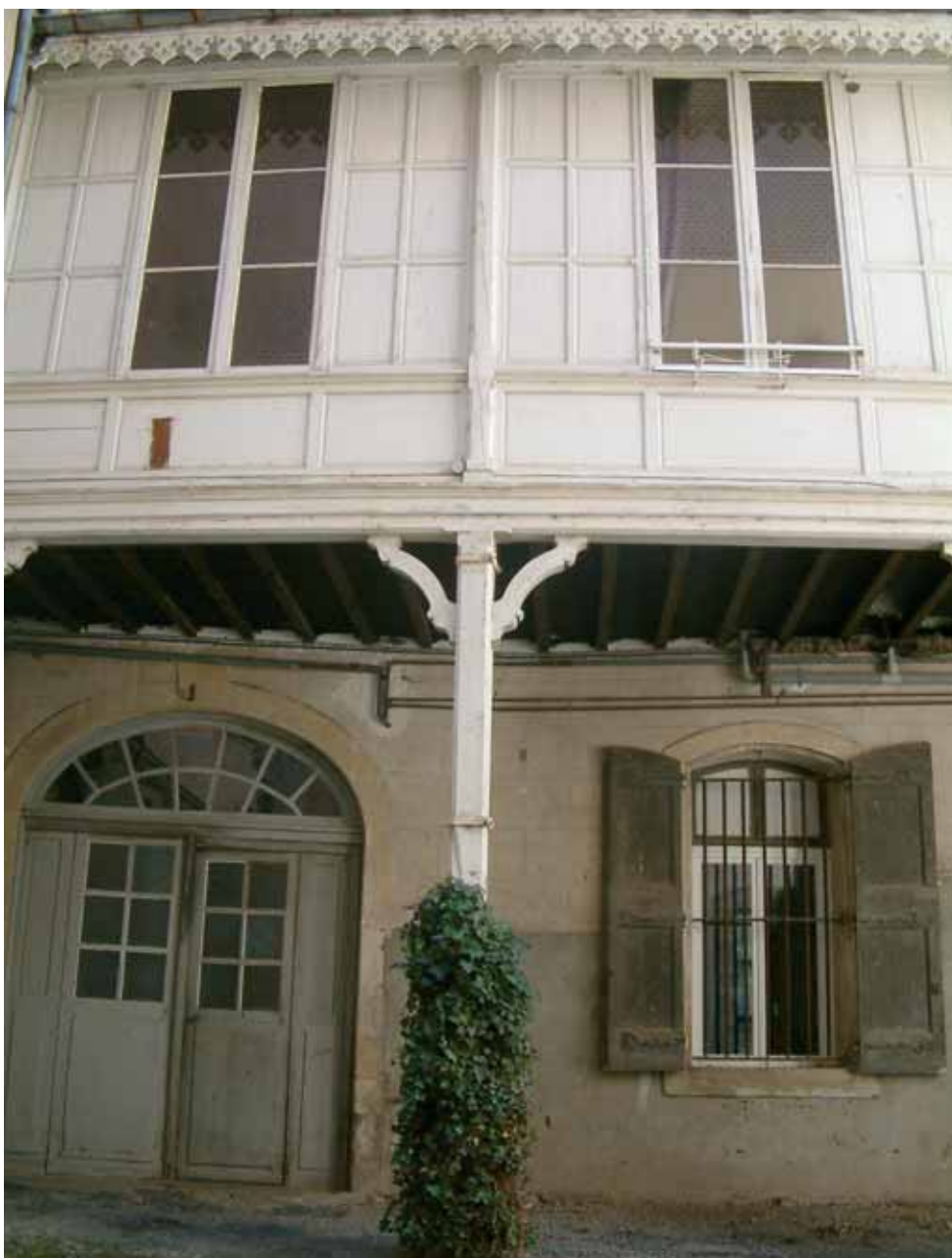
La cour d'un hôtel particulier