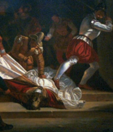
Dans la nuit du 3 au 4 juillet 1573, le corps de Saint-Fulcran, miraculeusement conservé jusqu'alors, est profané