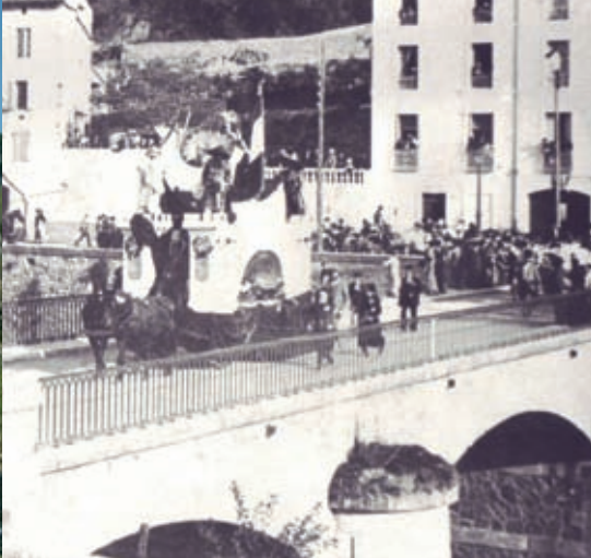
Défilé de chars en 1898