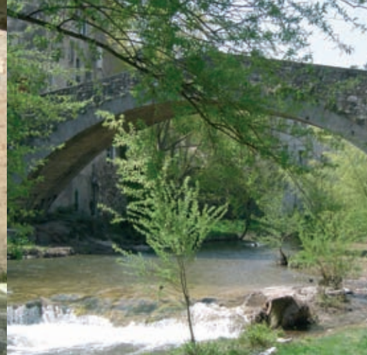
De facture romane, le pont de Montifort datant du XIV e siècle était emprunté par les pèlerins de Saint-Jacques de Compostelle allant vers Toulouse