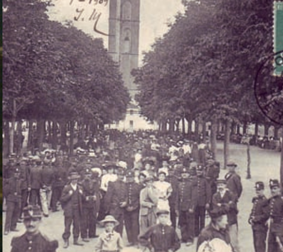
Lodève fut une ville de garnison jusqu'en 1921