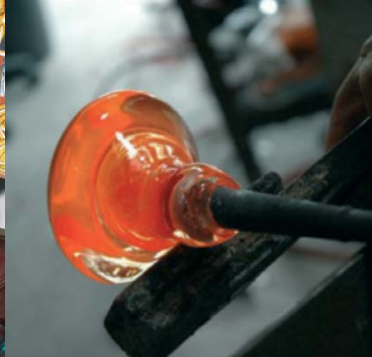
Les professionnels des Métiers d'Art sont les dépositaires et les gardiens de savoir-faire anciens et novateurs.