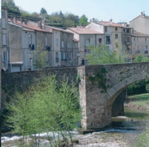
Le pont du Miton ou du Barry permettait de franchir la Soulondres vers le faubourg de Montbrun qui constituait une agglomération à part, entièrement close