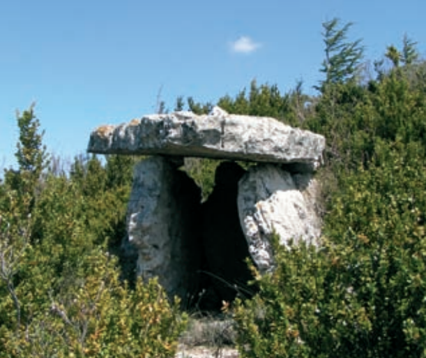
Dolmen entre Lodève et les Plans

Le sol lodévois est parcouru et habité depuis fort longtemps. La découverte de grottes au lieu-dit de Tréviols révèle la présence de l'homme préhistorique du paléolithique supérieur sur l'actuelle commune de Lodève. Des mégalithes (dolmens et menhirs) retrouvés en très grand nombre sur l'ensemble du Lodévois, attestent des pratiques funéraires importantes au chalcolithique. On sait également que vers 500 avant notre ère, le Grézac abrite un oppidum , ou place fortifiée, dont le rôle apparaît étroitement lié à sa position stratégique de lien entre Causses et plaine, de contrôle et de commerce.