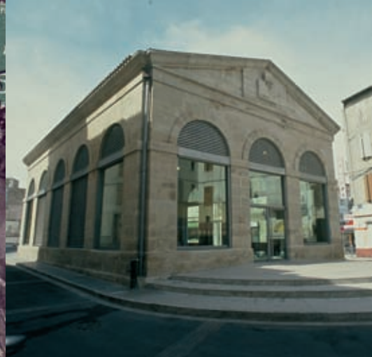
En 1997, la réhabilitation de la Halle au cœur de la ville marque le début de la mise en œuvre d'une démarche patrimoniale et culturelle d'envergure à Lodève

d'autonomie et un véritable pouvoir sur la gestion des affaires civiles. Enfin, alors qu'ils viennent de connaître quelques siècles de prospérité au cours desquels l'industrie textile a pu se développer, Lodève et le pays lodévois doivent endurer les incursions répétées des routiers et les excès des gens d'armes royaux pendant la Guerre de Cent ans, mais aussi les disettes et épidémies de peste des XIV e et XV e siècles.