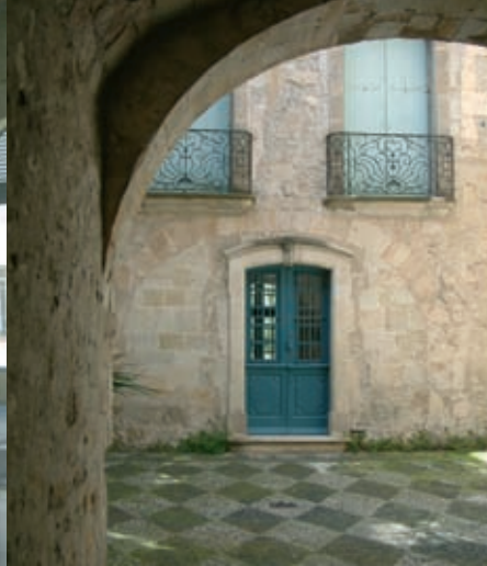
Le remarquable pavage de galets (calade) est caractéristique des Hôtels du XVII e siècle du nord de l'Hérault