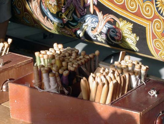
Le tapis Savonnerie est exécuté sur un métier vertical appelé métier de haute lisse

Cabanes, puits, murs d'épierrage ponctuent les paysages du nord de Lodève, au pied des falaises du Grézac notamment. Afin de pouvoir tirer meilleur parti de ces parcelles difficiles à exploiter, des murets horizontaux furent érigés : ils permirent de stabiliser les éboulis, de bonifier les sols et ainsi de cultiver quelques légumes ou de créer de petits vignobles en terrasses. Le Mont Grézac et le Puech Montbrun étaient ainsi couverts de terrasses.