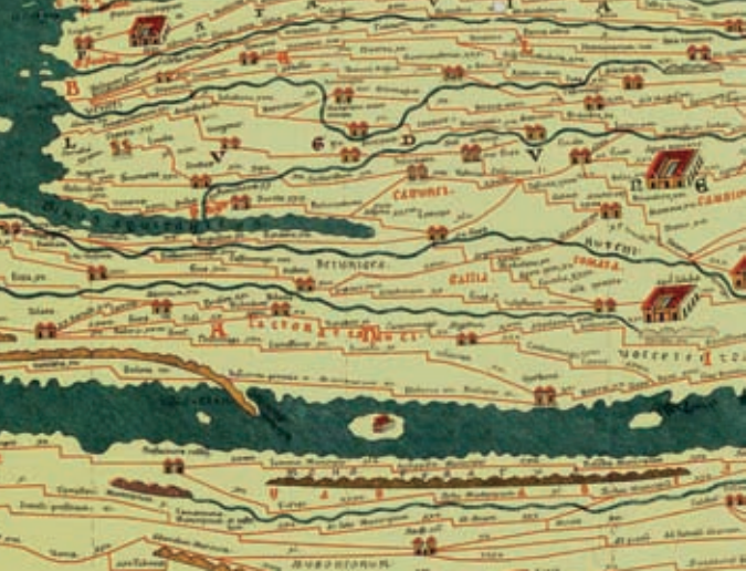
Loteva figure sur la Table de Peutinger, inscription sur parchemin datée du début du III e siècle, du géographe romain Castorius

Nichée au creux de frontières naturelles incontestables mais ouvertes, Lodève a été façonnée à même les rivières et à même les montagnes.