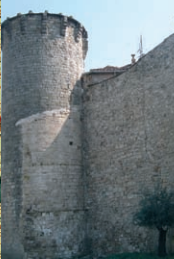
L'enceinte de la ville qui se composait de 5 tours, de 7 portes et dessinait avec ses remparts "la forme d'un violon" selon l'évêque Plantavit de la Pause