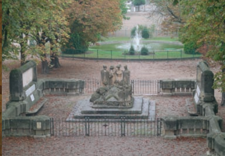
Le Monument aux Morts de Paul Dardé constitue une synthèse de sculpture et d'architecture monumentale intégrée dans le paysage