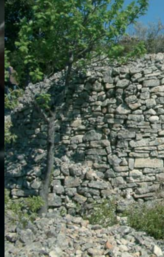
Cabane en pierres sèches sur le Grézac