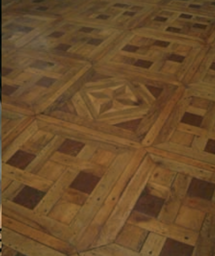
La Salle des mariages, de style empire, présente l'un des parquets les plus remarquables de l'Hôtel de Ville