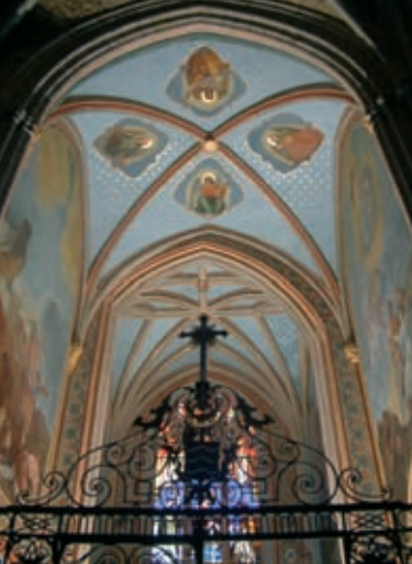
La restauration de la Chapelle Saint-Fulcran et de ses peintures murales a permis de retrouver le faste recherché au XIX e siècle

La ville réunit un patrimoine diffus et omniprésent, témoin d'une opulence passée et d'un véritable sens du raffinement.