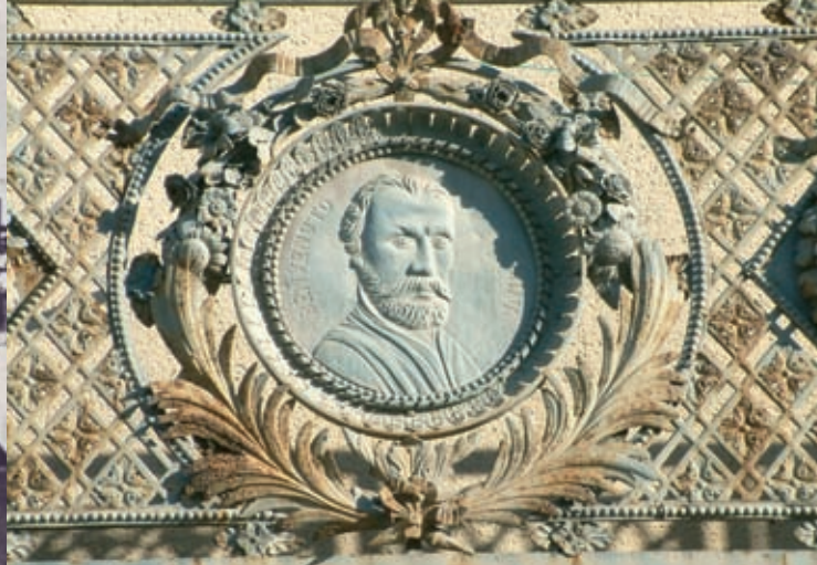
Le balcon de la maison natale de Cusson présente trois grands médaillons en cuivre repoussé