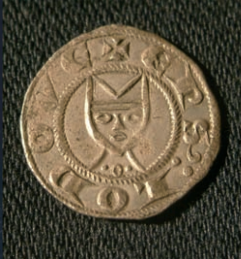
Denier d'argent frappé à l'effigie de Saint-Fulcran, Musée Languedocien, Montpellier, collection de la Société Archéologique de Montpellier