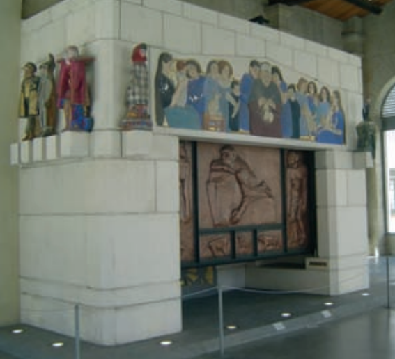
Sur le linteau de la Cheminée Monumentale, la scène de la Mère-grand contant à ses petits enfants